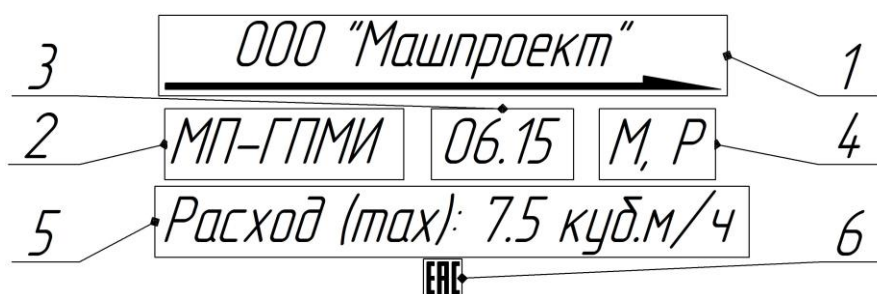
1 – Название фирмы; 2 – Название изделия; 3 – Месяц и год изготовления; 4 – Коды используемых горючих газов; 5 – Максимальный расход горючего газа (единицы измерения м 3 /ч) 6 – Единый знак обращения продукции на рынке государств-членов Таможенного союза

Вид и объяснение маркировки показаны на рисунке 2.